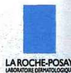
LA ROCHE-POSAY LABORATOIRE DERMATOLOGIQUE