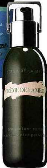
The Radiant Serum, Crème de la Mer, 260 €.