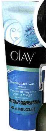
Foaming Face Wash, Olay, 5 $ (env. 4 €).