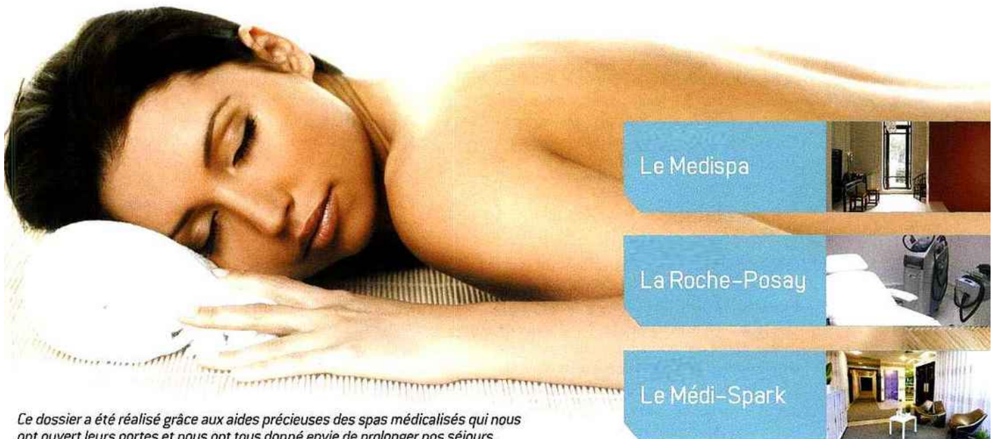
Ce dossier a été réalisé grâce aux aides précieuses des spas médicalisés qui nous ont ouvert leurs portes et nous ont tous donné envie de prolonger nos séjours.

Ainsi, on trouve en un seul lieu des spécialistes de l'esthétique à la pointe des dernières nouveautés, ce qui permet un suivi optimisé des traitements sans risque d'interaction entre eux et avec des échéances maîtrisées.