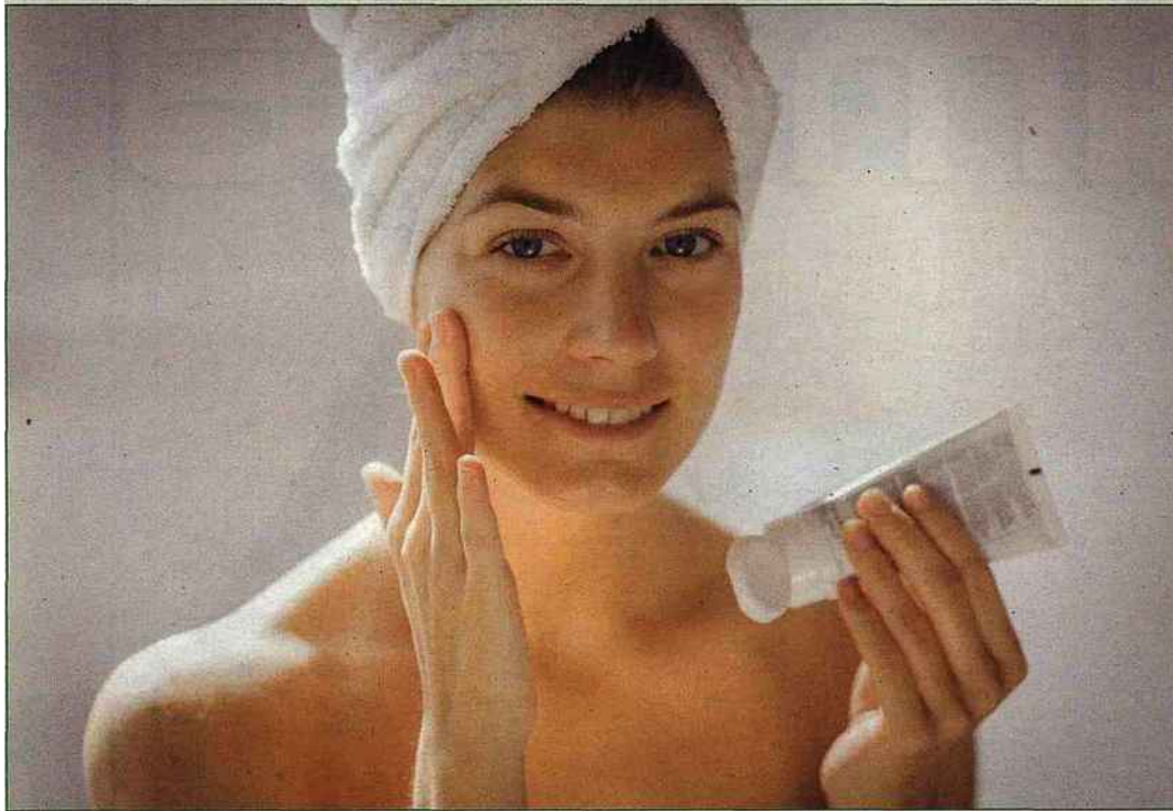
Les soins du visage font peau neuve

des plantes venues du bout du monde, essayez sans tarder les quatre joyaux de la gamme Global Expertise , leurs fragrances précieuses et leurs galéniques rares. Le prodige des eaux roses se poursuit en Camargue dans le salin d'Aigues-Mortes avec un duo antifatigue : une crème de nuit et un réveil contour des yeux (Eclaté) . Chez Mediceutics et Skinceuticals on aime les corrections, la crème riche Morpho-correctrice en inflige une aux agents démolisseurs des peaux matures, et l'émulsion Metacell Renewal B3 donne une claque aux symptômes précoces du photo-vieillessement. La gamme Eucerin Ultrasensible appuie là où ça fait mal, l'actif symstivite fait jouer la fibre nerveuse pour diminuer les sensations de chaleur et d'inconfort.