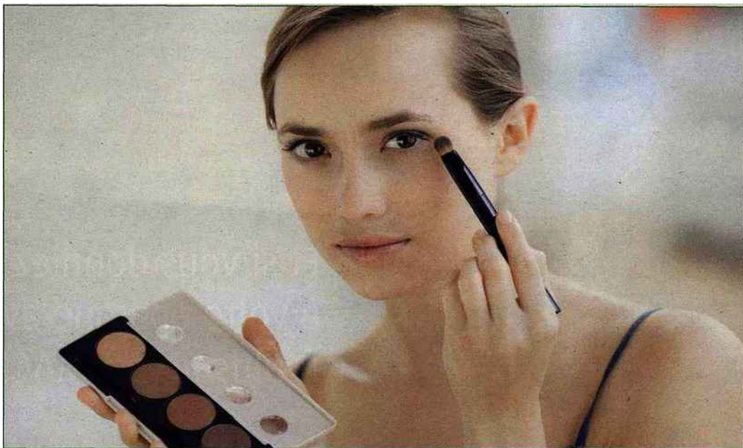
Science et beauté, couple star de l'officine

Non vous ne rêvez pas, c'est pendant votre sommeil que Cellu Destock Overnight vous aidera à modeler une silhouette affinée matin après matin. Le secret? L'hormone brûle-graisse adiponectine dégrade les acides gras jusqu'au bout de la nuit (Vichy). Le déstockage nocturne se poursuit grâce à la formule renforcée de l' Amincissant intensif 7 nuits (Somatoline Cosmetic) : vous allez perdre centimètres et kilos en dormant tranquillement pendant 7 nuits. Si vous préférez les bains de mer et les bienfaits de l'algotherapie, découvrez Algosilhouette et ses formules marines composées de trois extraits naturels d'algues pour trois gestes sur-mesure : le fucus vesiculosus pour plus de minceur, palmaria palmata pour plus de légèreté, alaria esculenta pour plus de fermeté (Algotherm). Devenez une « pro » de la minceur et remodeler vos cuisses