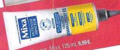
Intensif Minceur, Mixa, 125 ml, 9,99 €.