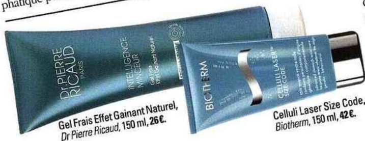
Gel Frais Effet Gainant Naturel, Dr Pierre Ricaud, 150 ml, 26 €.

Grâce à leurs complexes technologiques d'actifs anti-cellulite et de polymères tenseurs, ces crèmes créent un maillage qui fait rentrer le ventre et serrer la taille. A poser par des petits mouvements rapides et toniques.