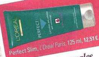
Perfect Slim, L'Oréal Paris, 125 ml, 12,51 €.

On favorise le déstockage, le raffermissement et le lissage via des cocktails d'actifs ultra-performants. Ils s'appliquent de bas en haut en petits massages « palper-rouler ».